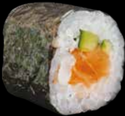
HOSOMAKI € 5,00 SALMONE E CETRIOLO