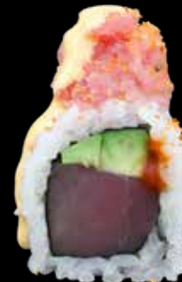
MAGURO SPICE € 13,00

salmone in tempura, avocado, surimi, sesamo, salsa teriyaki e maionese spicy