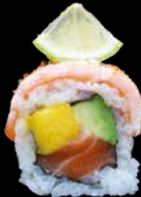
EXOTIC ROLL € 11,00

gambero in tempura, surimi, tanuki e salsa teriyaki