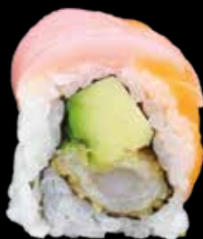
ARCOBALENO ROLL € 12,00

anguilla, asparago, cetriolo, cover di branzino, lime, salsa teriyaki e tanuki