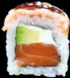
SAKE ROLL € 11,00

salmone, avocado, philadelphia, salmone scott, salsa teriyaki e sesamo