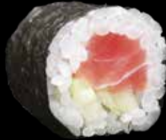
HOSOMAKI € 6,00 TONNO E CETRIOLO