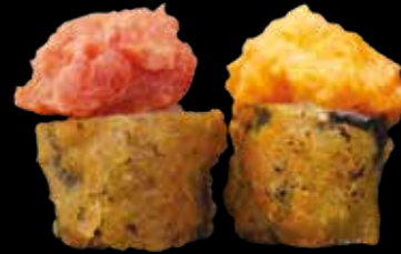
HOSOMAKI € 8,00 BLANCO