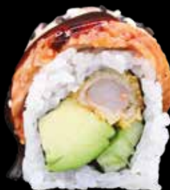
DRAGON ROLL € 13,00

ricciola, asparago, battuta di salmone spicy, sesamo, cover di ricciola e salsa al mango