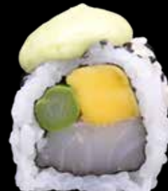
SUZUKI SPECIAL € 12,00

tonno, avocado, philadelphia, cover di tonno, maionese jap e salsa teriyaki