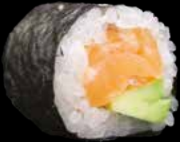
HOSOMAKI € 5,00 SALMONE E AVOCADO