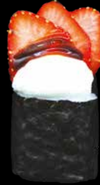
HOSOMAKI € 8,00 SALMONE PHILADELPHIA E FRAGOLA