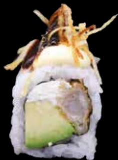
FRI ROLL € 13,00

gambero in tempura, philadelphia, avocado, maionese jap, teriyaki e chips di patate