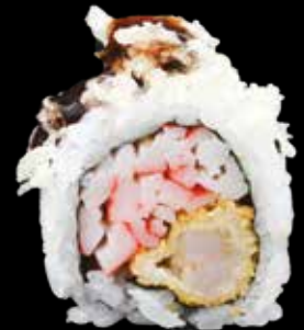
EBITEN € 12,00

branzino, asparago, mango, sesamo e maionese al basilico