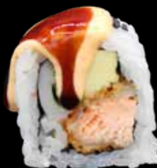
SPIKE ROLL € 12,00

gambero in tempura, philadelphia, avocado, maionese jap, teriyaki e chips di patate