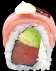
MAGURO ROLL € 13,00

salmone, avocado, philadelphia, salmone scott, salsa teriyaki e sesamo