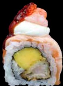
LADY ROLL € 15,00

gambero in tempura, mango, cover di salmone scott, philadelphia, gambero rosso, tobiko rosso e salsa teriyaki