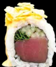
PICCA ROLL € 12,00

gambero in tempura, avocado, cover di salmone, branzino e tonno