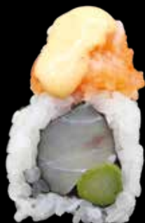
ICHIBAN ROLL € 14,00

gambero in tempura, mango, cover di salmone scott, philadelphia, gambero rosso, tobiko rosso e salsa teriyaki