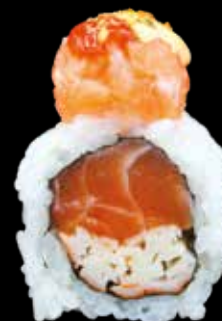
SPICY SAKE € 12,00

tonno, erba cipollina, cetriolo, scaglie di nachos e maionese spicy