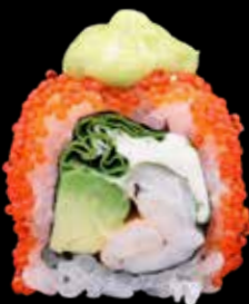
EBI SUPREME € 13,00

tonno, avocado, sriracha, battuta di tonno spicy, togarashi e maionese spicy