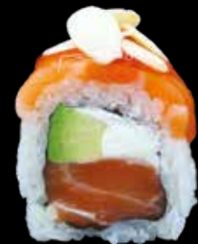
BLANCO SPECIAL € 12,00

ricciola, philadelphia, erba cipollina, cover di avocado e maionese spicy