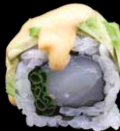
HAMACHI ROLL € 14,00

salmone in tempura, avocado, cover di salmone, tanuki, maionese jap e salsa teriyaki