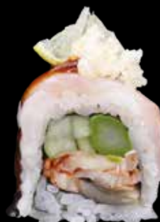
UNAGI ROLL € 13,00

gambero in tempura, avocado, cetriolo, cover di anguilla, sesamo e salsa teriyaki