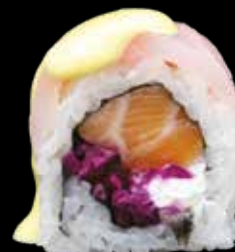
PRINCE ROLL € 15,00

gambero al vapore, lattuga, philadelphia, avocado, cover di tobiko rosso e maionese al basilico