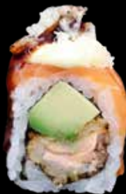
CRISPY ROLL € 11,00

salmone, avocado, mango, cover di salmone scott, lime e togarashi