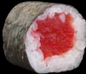
HOSOMAKI € 5,50 TONNO